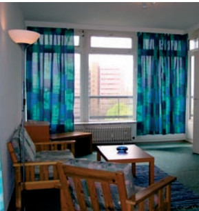
Wohnung in der Lindenstraße

Für alleinstehende Frauen und Männer, die