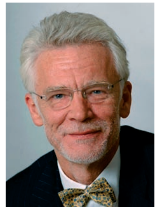
Prof. Dr. E. Jürgen Zöllner Senator für Bildung, Wissenschaft und Forschung

Für diesen Prozess wünsche ich Ihnen weiterhin viel Kraft, Kreativität und Durchsetzungsvermögen.