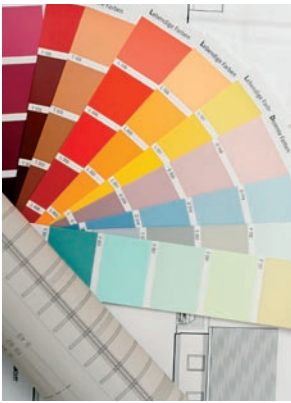
Farbtechnik in der JVA Frankfurt/Oder.

Justizvollzugsanstalten Frankfurt/Oder, Wulkow, Luckau-Duben