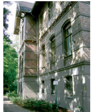
Betreutes Einzelwohnen am Sterndamm in Berlin-Treptow