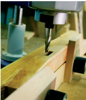
Holztechnik in den Werkstätten des Maßregelvollzugs.