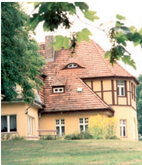
Freizeit- und Bildungsstätte Teupitz