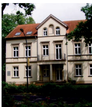
Kontakt- und Beratungsstelle in Neuruppin