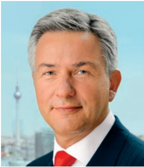
Klaus Wowereit Regierender Bürger- meister von Berlin „Die Stiftung darf stolz sein auf das in 50 Jahren Geleistete.“