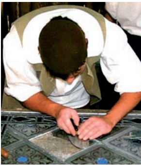
Ausbildung zum Glaser in der Schlesischen Straße.