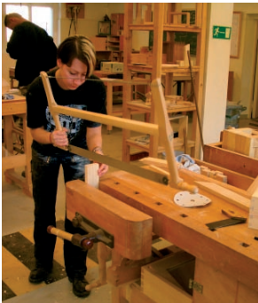
Ausbildung zum Tischler in den Werkstätten „Königsheide“.