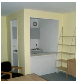
Wohnung im Übergangshaus Spandau, Cautiusstraße