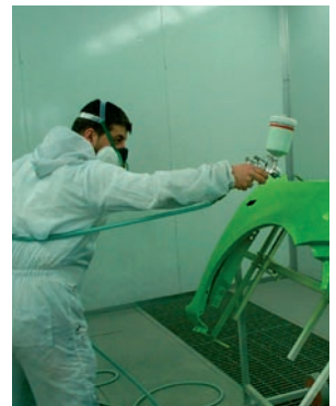
Ausbildung zum Fahrzeuglackierer im Ausbildungszentrum Schlachtensee: Aussenstelle Botanischer Garten.