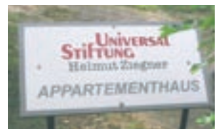
Wohnhaus in Berlin Steglitz-Zehlendorf, Bergstraße

Für den stationären Leistungstyp Übergangshaus wurde gemäß § 79 Abs. 2 SGB XII mit der Senatsverwaltung für Integration, Arbeit und Soziales eine Leistungsvereinbarung geschlossen, die selbstverständlich auch für die ambulanten Leistungsangebote vorliegt.