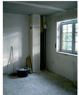
Qualifizierungslehrgang Bauhandwerk in der Justizvollzugsanstalt Charlottenburg.

Die vermittelten Fertigkeiten dienen der Vorbereitung auf eine weiterführende Qualifizierung nach der Haftentlassung bzw. der Erweiterung der eigenen handwerklichen Fähigkeiten.