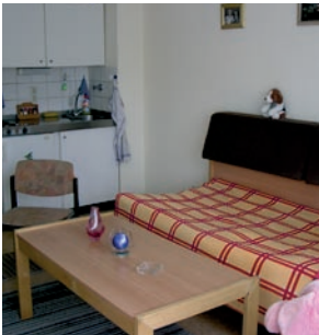
Wohnung im Übergangshaus Steglitz, Bergstraße